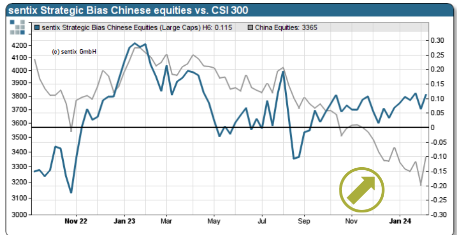
sentix Strategischer Bias Aktien China vs. CSI 300 Aktienindex

Die Chinesen feiern ihr Neujahr und begrüßen das „Jahr des Drachen“. In den letzten Handelstagen haben die dortigen Aktien ein „Reversal“ hingelegt. Sehr markant war dies bei den Mittelwerten (CSI 1000) zu beobachten, nachdem noch im Januar 2024 ein Ausverkauf auf breiter Basis stattgefunden hat. Die Anleger erkennen seit geraumer Zeit, dass der Kursrückgang dort eine Investmentchance darstellt: Der Bias emanzipiert sich und zeichnet ein völlig anderes Bild als für die übrigen Aktienmärkte. Auf der Sektorseite zeigt sich das gewohnte Bild: Die Anleger sind verliebt in Pharma und Technologieaktien.