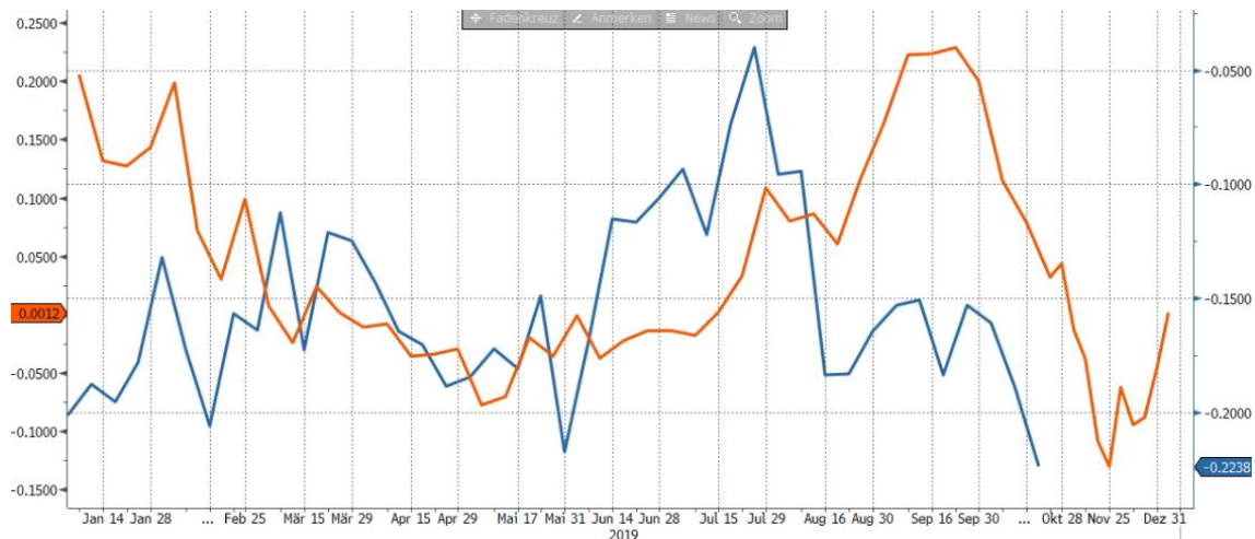
sentix Strategischer Bias Aktien Deutschland (Verlauf in 2018) und Euroland Renten (Verlauf in 2019)

Vor einem Monat thematisierten wir an dieser Stelle die Entwicklung im Strategischen Bias zu deutschen Aktien und die Frage, ob sich eine negative Q4-Entwicklung wie 2018 auch im Jahr 2019 wiederholen könnte. Bislang divergiert die Entwicklung im Bias so stark, dass wenig für eine Wiederholung der schwachen Aktienkursentwicklung spricht. Anders sieht dies bei Bonds aus!